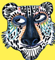
ILLUSTRATION KITTY COYNTHER

Du 16 au 20 juillet ATELIERS DE FABRICATION DE MARMITES Bibliothèque de Choungui (02 69 62 96 88)